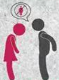
DESIGUALDAD Y DISCRIMINACIÓN